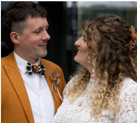
Verstärkte Naturlocken, halboffen