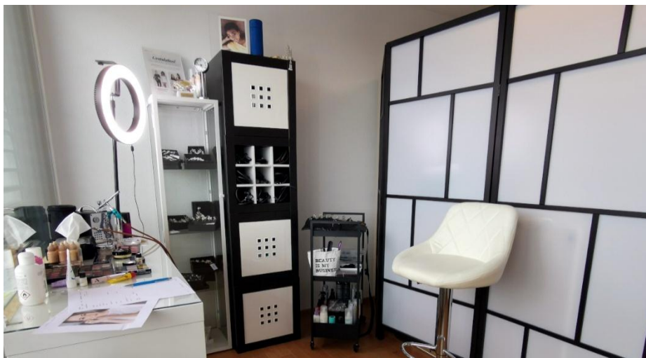
Mein Homestudio in Kaltbrunn – hier findet dein Probetermin üblicherweise statt

Beim Probetermin legen wir gemeinsam deinen Zeitplan fürs Getting-Ready fest und planen das Zeitfenster für dein Brautstyling inkl. Zeitpuffer ein.