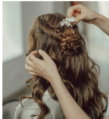
halboffene Wellen mit Geflecht