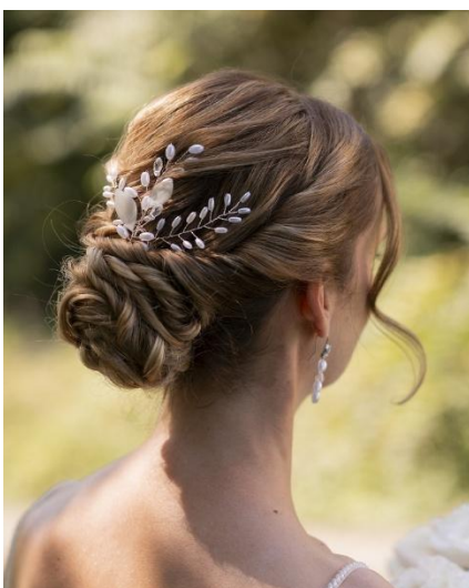
Romantisch verspielter Updo

Ob voluminöse Hochsteckfrisur, sanfte Wellen oder filigrane Flechtkunst – ich style jede Brautfrisur nach Wunsch und für jeden Haartyp.