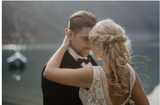
halboffene Frisur mit modernen Locken und Clip-Ins