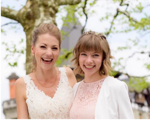
Make-Up mit Naturprodukten

Abgestimmt auf die Bedürfnisse und Wünsche der Kundin erstelle ich sehr gerne eine individuelle Offerte, bei der die Braut nur das bezahlt was sie haben will und ein Angebot passend zur ihren Ansprüchen erhält. Mein Angebot umfasst viele Optionen: HD-Make Up, Airbrush-Make Up, Haarstyling, Make-Up mit hypoallergenen Produkten, veganes Make-Up, tierversuchsfreies Make-Up u.v.m.