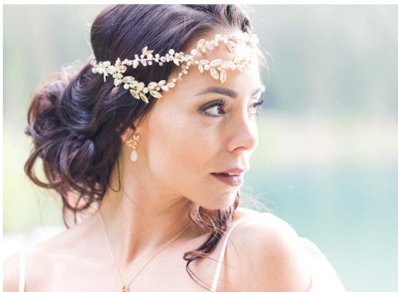
Haarstyling von mir im undone-look

Dank meiner Weiterbildung zur Haarstylistin habe ich auch die Fähigkeit, moderne Brautfrisuren zu gestalten. Von verschiedenen Hochsteckfrisuren bis hin zu simplen voluminösen Locken. Mein Stil ist eher «locker», «undone».